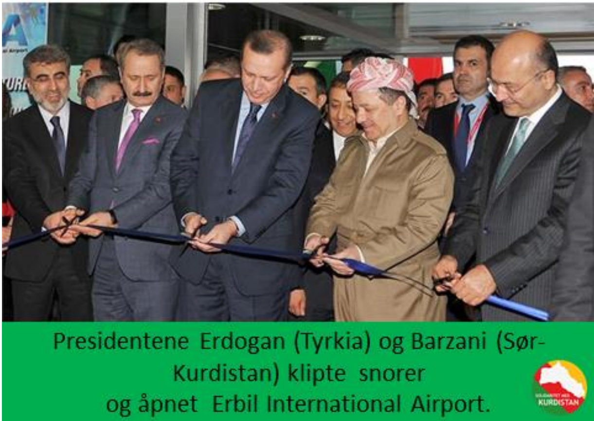
Bilde 22: Det har både politisk og symbolsk betydning når presidentene Erdogan og Barzani poserer sammen overfor media. Som her da de to for noen år siden stod skulder ved skulder og åpnet den nye flyplassen i Hewler.